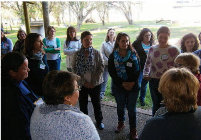
Foto 2. Dinámica de presentación de los participantes

Al cierre de este último taller se desarrolló una dinámica (juego de barajas) que motivó a las mujeres a planificar actividades futuras dentro de las organizaciones a las que pertenecen con el objetivo de alcanzar la consigna-meta del taller, que era lograr “una más en la directiva” de cada una de las organizaciones. Entre lo más destacado por las participantes del ciclo de formación, al realizar la evaluación final, se mencionó que: “no estamos solas”; “nos fortalece, crecemos como personas”; “nuevas expectativas”; “somos visibles”; “nos socializamos”; “adquirimos nuevos conocimientos”; “conocimientos de diferentes realidades”; “cada vez más participación de las mujeres”; “metodología buena” .