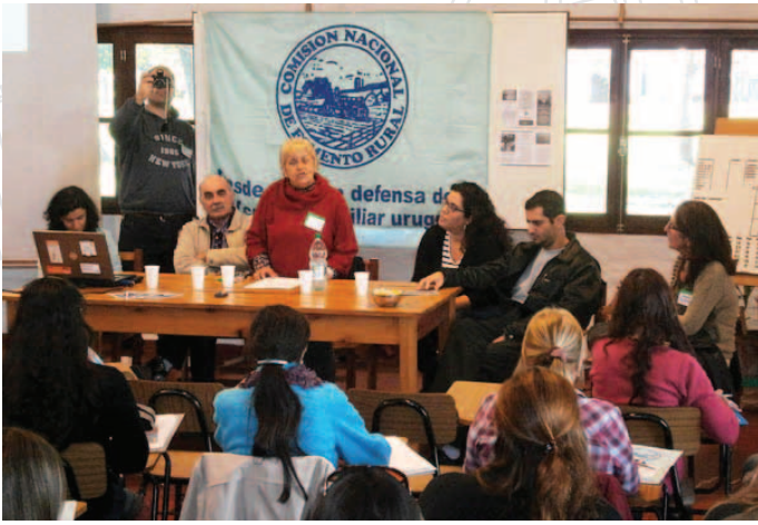
Foto 1. Ceremonia de apertura del Ciclo de Capacitación