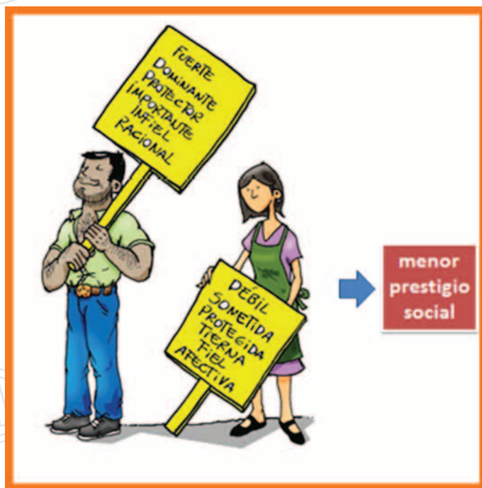
Figura 2. Estereotipos