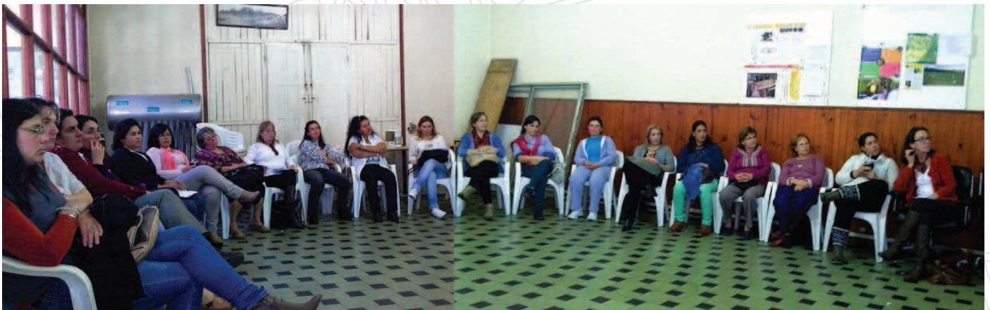
Foto 5. Distribución de las participantes durante la exposición

“Uno de los jóvenes que participó en el taller de género dijo en la Mesa de Desarrollo que recién se había dado cuenta de una cantidad de cosas que en su vida cotidiana está haciendo con un sesgo de género impresionante y se había dado cuenta