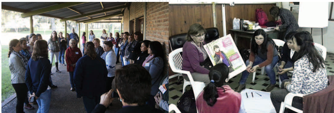
Figura 4. Los talleres del ciclo de capacitación con perspectiva de género pusieron en cuestión los estereotipos de varones y mujeres.

tividad de instancias de capacitación (nueve en total). Se buscó formar un grupo estable, con similar número de mujeres y varones, que participara de todas las propuestas. Las actividades de este ciclo, que comenzaron en el 2014 y finalizaron en 2016, combinaron los talleres con instancias recreativas,