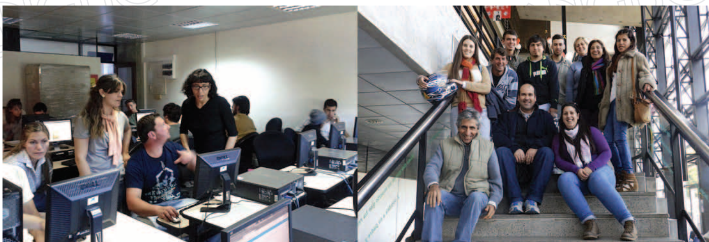
Figura 3. Se realizaron dos instancias del primer taller del ciclo de jóvenes, ambas en la sede Salto del CENUR Litoral Norte, donde se utilizaron las instalaciones de la sala de informática.

El ciclo de talleres dirigidos a jóvenes fue el de mayor can-