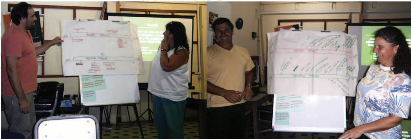
Figura 2. Actividades del ciclo de capacitación para directivos y directivas.

confeccionado especialmente para la actividad. Se entregaron también informes de las actividades y resultantes del ciclo de talleres a participantes y equipos técnicos de las organizaciones. Los talleres del plan de capacitación dirigido a directivos y