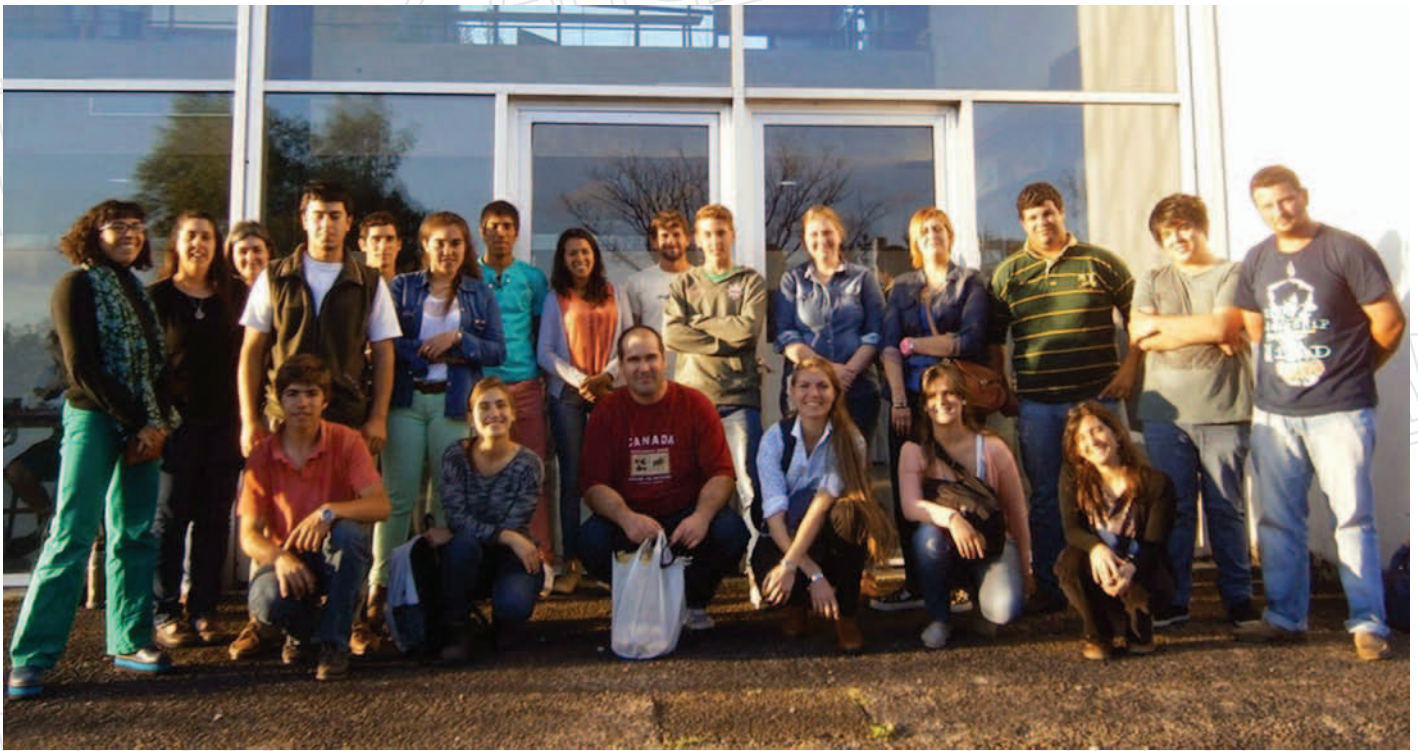
Inicio de ciclo de capacitación para jóvenes en Sede Salto del Cenur Litoral Norte.

tangibles e intangibles obtenidos se vinculan y retroalimentan en las personas, la herramienta parece contribuir eficazmente al fortalecimiento de las organizaciones a las que pertenecen los participantes.