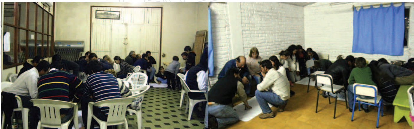
Figura 1. Las “Jornadas Cero” se realizaron en los espacios de reunión habituales de las SFR que presentaron el plan de capacitación de forma conjunta.

Freire, como gran principio inspirador (Figari y Rossi, 2007; Rossi y de Hegeú, 2010).