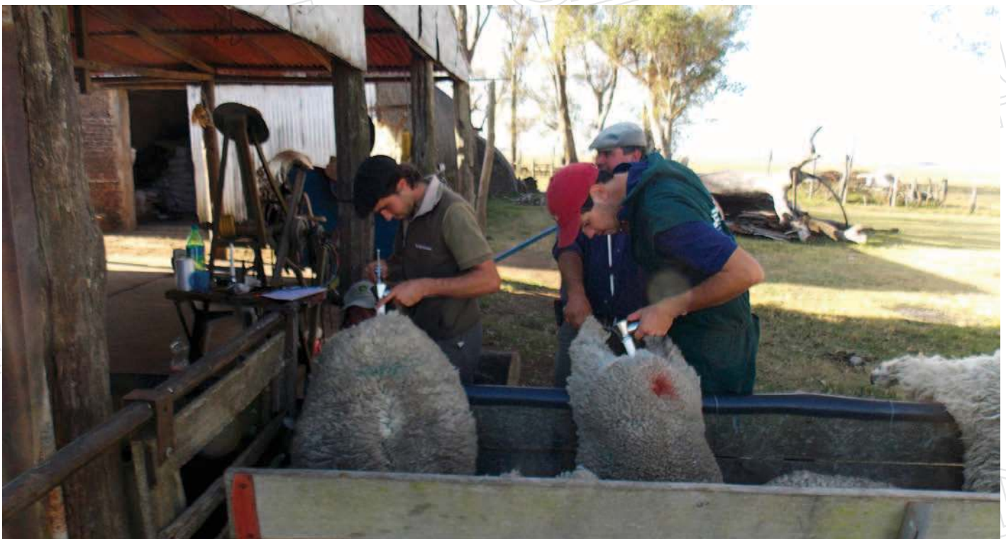
Inseminación artificial de ovejas apoyadas sobre el tubo

A pesar de observarse una menor respuesta y sincronía en la aparición de los estros en las ovejas sincronizadas con los intervalos “largos” de separación entre dosis de PG (PG14 a PG16), éstos obtuvieron mejores resultados reproductivos al servicio de IATF vía cervical en comparación con los intervalos denominados “cortos” y/o “intermedios” de separación (PG7 a PG13). Aunque en crecimiento, bajos niveles de progesterona en la fase luteal del ciclo estral previo al servicio han sido asociados con alteraciones de la función esteroideogénica de los folículos pre-ovulatorios (Coleman y Dailey, 1983; Fierro et al. , 2011, 2016a), lo cual afectaría el desarrollo de los ovocitos, su fertilización y el desarrollo de los embriones (Folman et al. , 1973; Ashworth et al. , 1989; González-Bulnes et al. , 2005; Fierro et al. , 2011), disminuyendo la fertilidad y fecundidad (Folman et al. , 1973; Fierro et al. , 2011, 2016a, b). La fertilidad del estro en las ovejas provenientes de intervalos “cortos” de separación entre dosis de PG no mejoró cuando fueron inseminadas con semen fresco a estro “detectado” y no a “tiempo fijo” (Olivera-Muzante