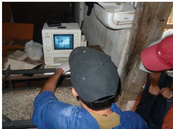
Seguimiento de dinámica mediante ecografía vía transrectal

El Experimento III se llevó a cabo para cuantificar la tasa de preñez (gestantes/total de ovejas; %), la prolificidad (fetos/oveja