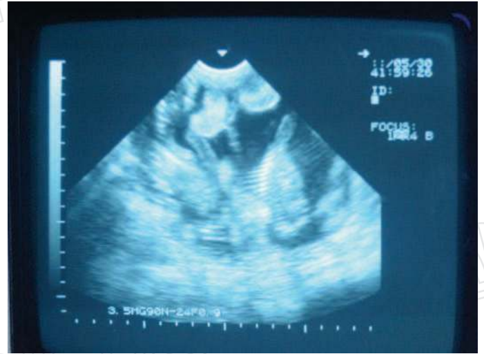
Imagen de ecografía vía abdominal de dos fetos de unos 60 días de edad

separación entre dosis de PG (intervalos “largos”) equipararían los resultados reproductivos del protocolo en base a P4-eCG.