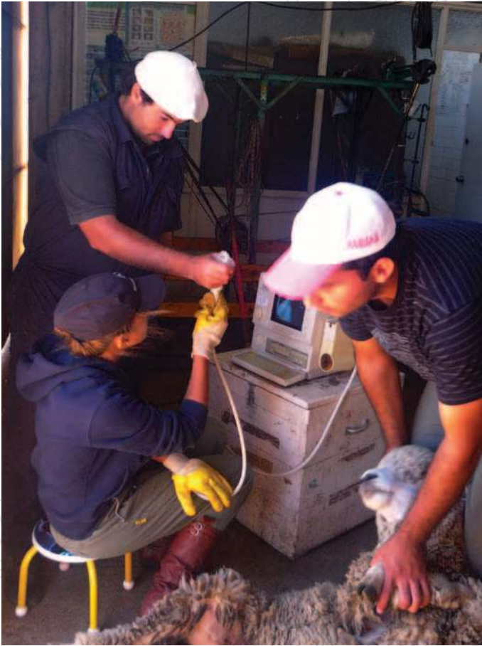
Ecografía abdominal para determinar carga fetal