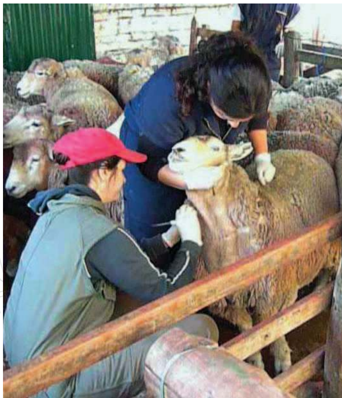
Extracción de sangre vía yugular para cuantificar niveles plasmáticos hormonales

Los principales resultados respecto a los niveles hormonales se resumen en la Figura 1. Se puede observar (imagen izquierda) que las ovejas de los intervalos PG14 y PG16 tuvieron fases luteales previas a la inducción de estro -luego de la segunda PG- más largas, con niveles plasmáticos de progesterona más elevados y por más tiempo, en comparación con los intervalos PG10 y PG12 (Días -8 a -4 respectivamente; P < 0,05 ). No se observaron diferencias en estas variables después de la segunda PG para los intervalos comparados ( P > 0,05 ). A su vez (imagen derecha), los niveles plasmáticos de estradiol en las ovejas de los intervalos PG14 y PG16, fueron mayores al inicio del estro y hasta 12 horas de comenzado éste, en comparación con los intervalos PG10 y PG12 ( P < 0,05 ). Se observó además, una correlación positiva entre la duración de la fase lútea y los días con niveles plasmáticos elevados de estradiol ( r = 0,78 ; P < 0,001 ). No obstante, no se apreciaron diferencias en la hora de ovulación en las ovejas de los diferentes intervalos de separación entre dosis de PG considerados ( 72,0 \pm 6,6 ;