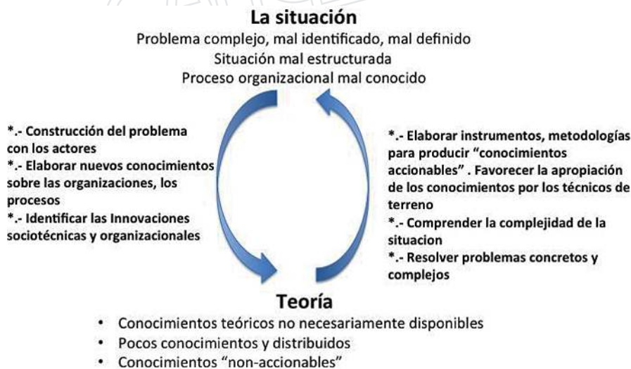
Figura 3. Proceso de “ida-vuelta” entre realidad y teoría

La agroecología, como nuevo paradigma del desarrollo de las explotaciones agrícolas y de los territorios, es una oportunidad para poner sobre la mesa (de diálogo, de gestión...) las maneras de trabajar, de relacionarse y de desarrollar nuestras capacidades reflexivas de la misma manera que las relaciones entre “ciencia y sociedad”. La agricultura familiar, por sus prácticas y valores, representa un gran aliado de la agroecología sin embargo deberá organizarse para repensar colectivamente el cambio de oficio que le impone la agroecología no solo en sus prácticas técnicas (animales y vegetales) sino que también en sus prácticas comerciales y en las relacionales con el resto de los actores de la sociedad.