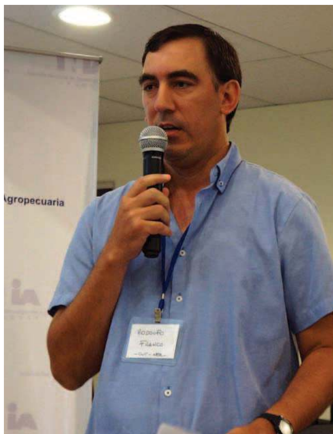
Rodolfo Franco Núcleo de Estudios Rurales, Sede Tacuarembó, Udelar.