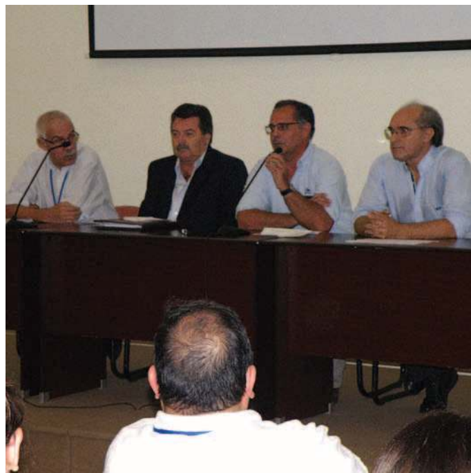
Autoridades de la Sede Tacuarembó de la Udelar, Intendencia de Tacuarembó, INIA y MGAP durante la apertura del evento.