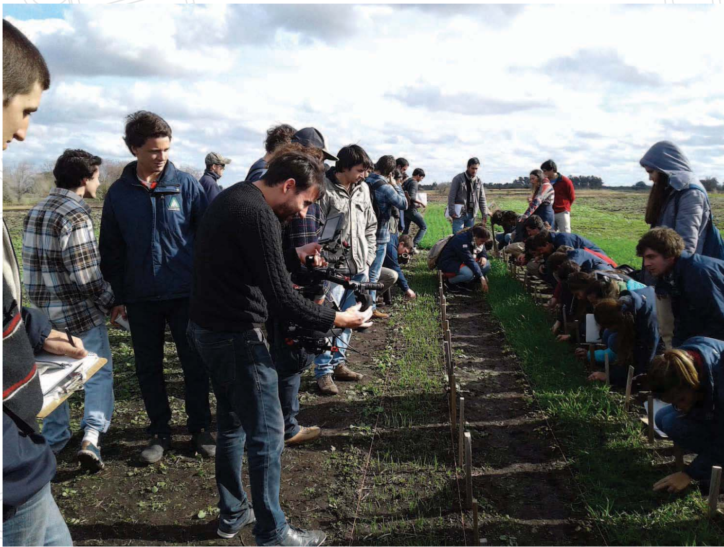
El fotógrafo y director documenta a los estudiantes de 4º año de Fagro en momentos en que realizan un relevamiento de cereales.