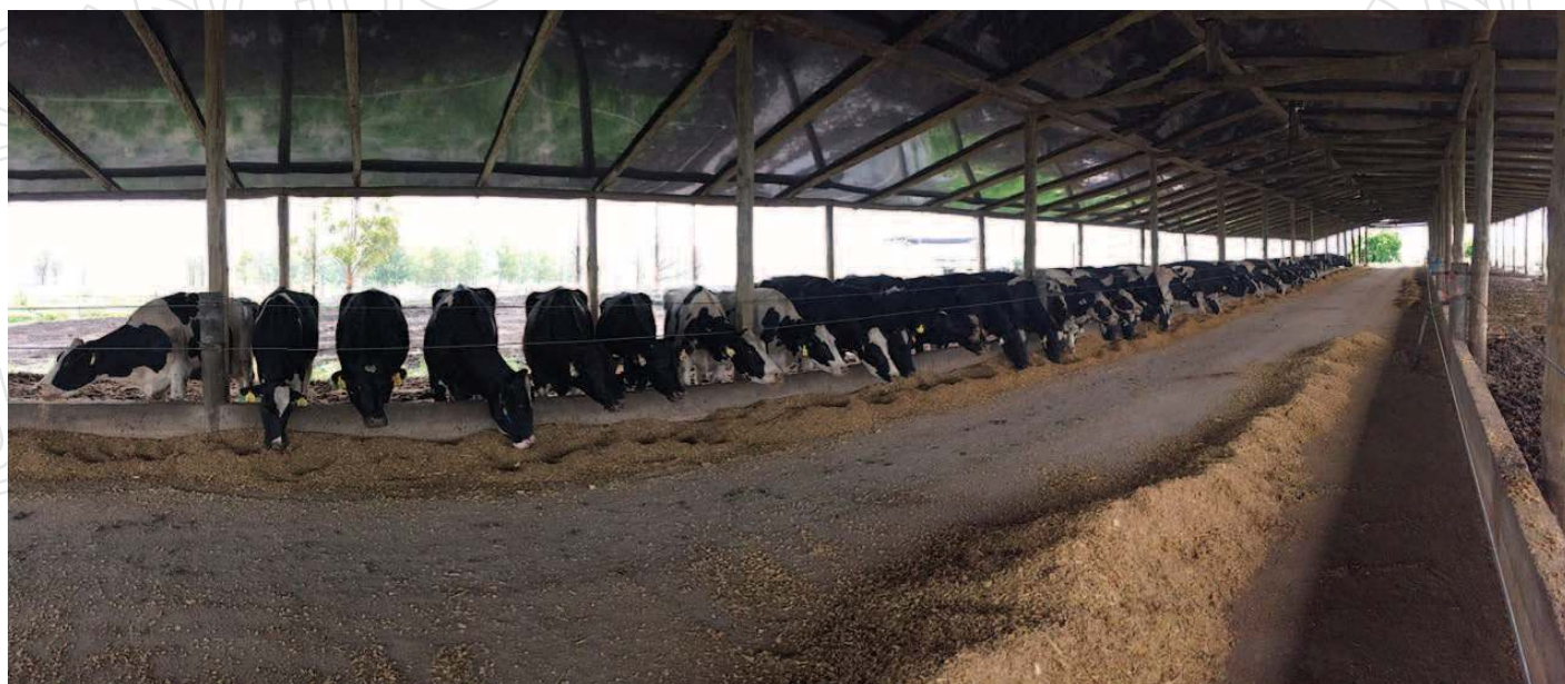
Comedero de alimentación de dieta mezclada.

Del análisis de estos experimentos se puede concluir que es posible combinar DTM con pasturas y tener resultados productivos y reproductivos similares a los de animales alimentados únicamente con DTM, dependiendo del nivel de inclusión de pasturas que se utilice. En búsqueda de mejores estrategias de alimentación se llevó a cabo un trabajo experimental con el objetivo de evaluar la performance productiva y reproductiva durante los primeros 180 días post parto en vacas paridas en primavera alimentadas con diferentes combinaciones de DTM y DPM.