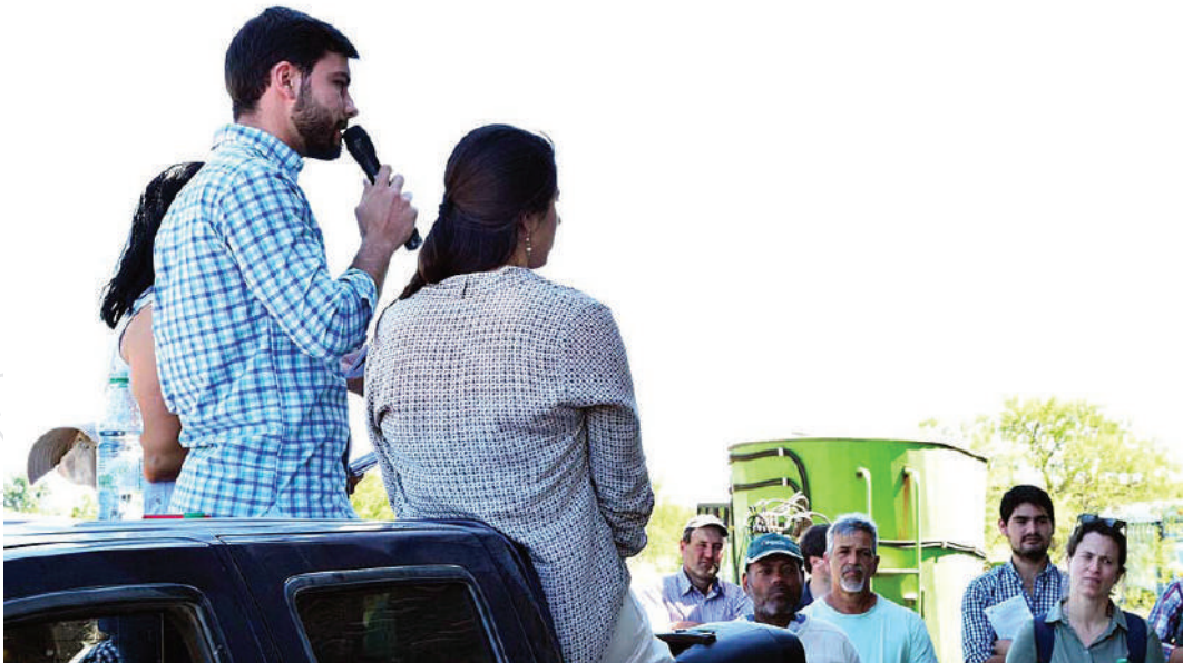
En la Jornada abierta sobre a plataforma experimental -realizada en noviembre de 2019-, el joven brasileño comenta parte de la investigación que lleva adelante en el marco del proyecto sobre el control del ambiente productivo.