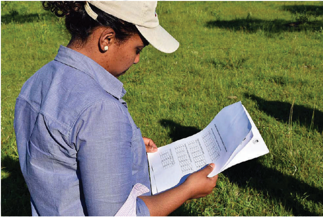
La estudiante de doctorado estudia los datos de un ensayo durante la Jornada Anual de Pasturas de 2019.