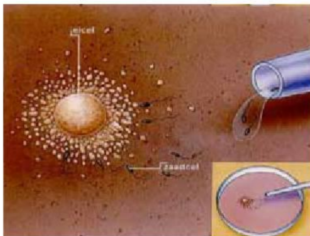
Figura 3. Fertilización in vitro. (Extraído de curso "Técnicas Reproductivas" 2009)

En la próxima década esperamos el desarrollo de sistemas de cultivo "in vitro" que produzcan embriones con las mismas características y propiedades que los "in vivo" y que superen los inconvenientes actuales.