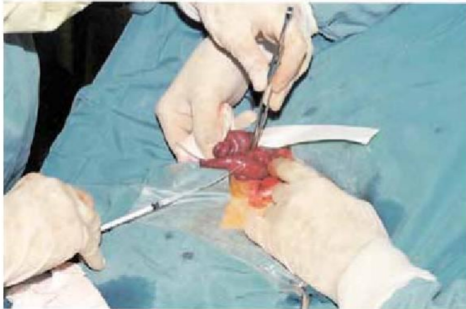
Figura 2. Transferencia embrionaria en Cabra. (Extraído de curso "Técnicas Reproductivas" 2009)