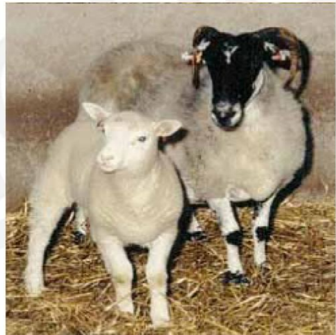
Figura 5. Dolly y su madre.

La célebre oveja (Dolly) fue creada por clonación de células somáticas que consiste en la introducción de una célula somática (del cuerpo) en el embrión (Figura 5). Pero existe otra técnica más antigua: la clonación por células de embriones mediante la cual se divide un embrión y se obtienen gemelos idénticos. A través de esta última técnica hace 20 años, hay animales clonados.