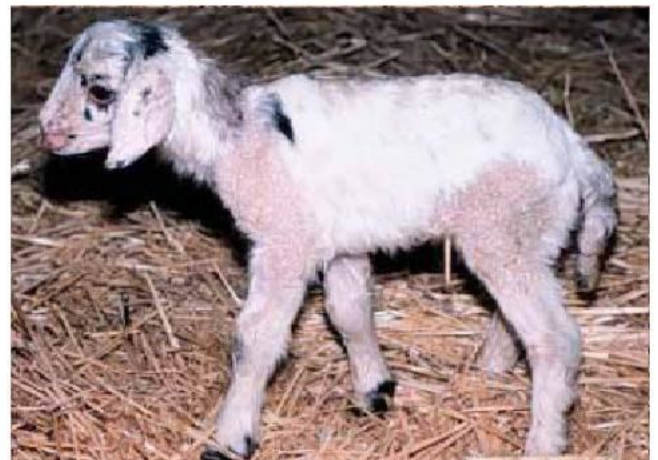
Figura 6. Quimera de Cabra y oveja. (Extraído de curso "Técnicas Reproductivas", 2009)