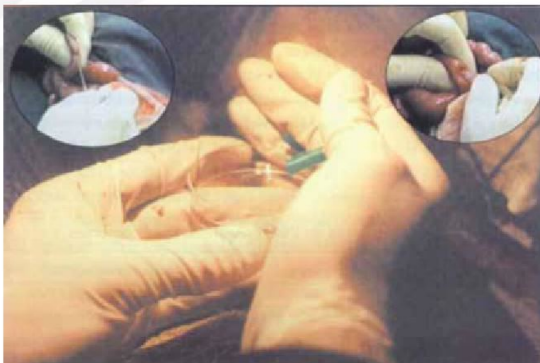
Figura 1. Recolección del líquido de lavado. (Extraído de curso "Técnicas Reproductivas", 2009)

Recién en 2001 en nuestro país se realizan comercialmente y por rutina los primeros programas de multiovulación y transferencia de embriones (MOET) en número importante de dadoras o donantes de embriones ovinos SAMM y Dorper por un equipo uruguayo (Boggio et al., datos no publicados). La transferencia de embriones y sus técnicas asociadas no se han aplicado tanto en ovinos como en bovinos. Una de las causas es el costo relativo de los embriones, imposibilidad práctica de canular el cuello uterino y la heterogeneidad en la respuesta superovulatoria. Tomando en cuenta los costos del proceso, un producto de transferencia de embriones debería valer dos o tres veces más que uno por servicio natural, esto limita la aplicación a gran escala en nuestro país (Bonino y Sienra, 1986, citado por Fernández Abella, 2006). Es una técnica que aún necesita mucha investigación, para hacer más repetibles los resultados bajo distintas circunstancias y razas.