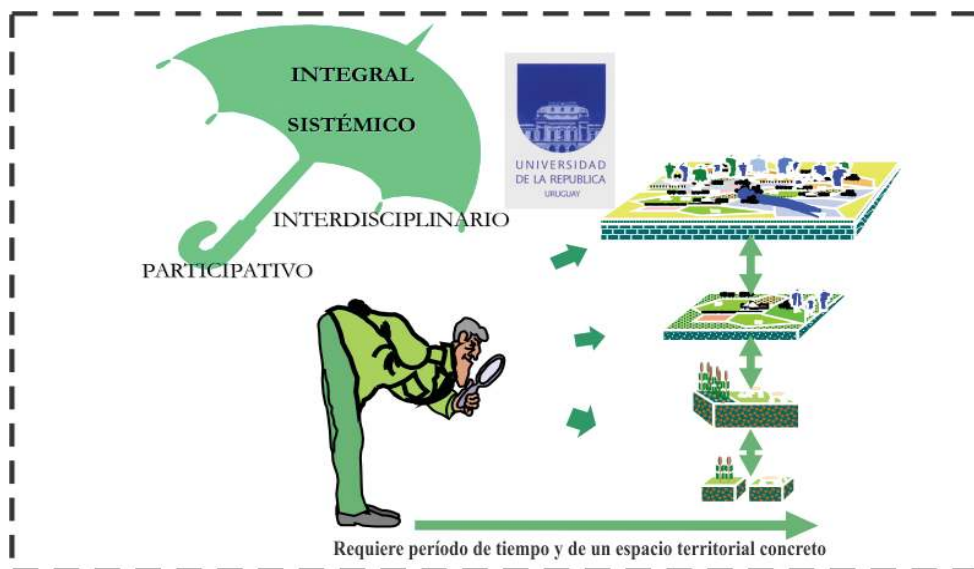
Figura 1. Caracterización del PIE y principios teórico-metodológicos.

Para trabajar con este enfoque fue necesaria no sólo la conformación de equipos multi e interdisciplinarios, sino buscar acuerdos de trabajo en conjunto con otras instituciones, y desarrollar una estrategia de alianzas institucionales que ampliara la perspectiva local. Esto permitió redefinir el rol de la Universidad en las distintas etapas de las intervenciones, de forma de avanzar desde un esquema en el que los actores principales eran únicamente el equipo universitario y los productores de la zona, hacia un esquema tridimensional, con nuevos actores.