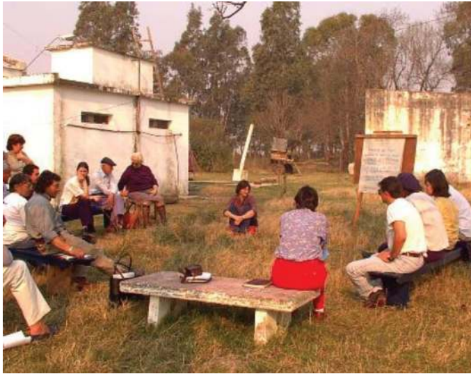
Foto 3. Equipo del PIE en Reuniones Generales con vecinos de la zona. Escuela Rural N° 40, Colonia Pintos Viana, Guichón (2003)