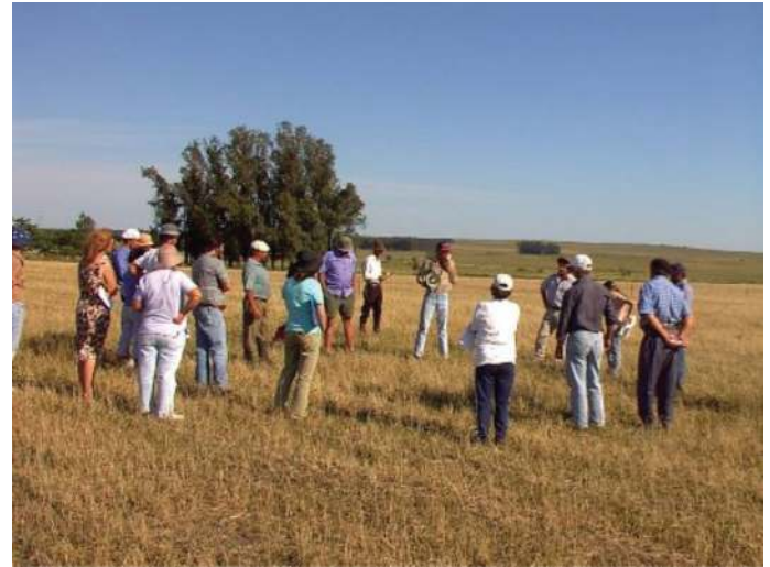
Foto 4. Equipos del PIE en una Jornada de campo en establecimiento de unas familias de la zona de Guichón (2004)

interdisciplina como condición, sin una práctica que la convoque o requiera, no parece ser el camino adecuado para la construcción de espacios o momentos interdisciplinarios.