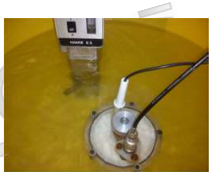
Figura 2. Montaje para simular las condiciones de medida en planta. En este caso se construye una celda totalmente sumergida en el baño termostático de forma de reproducir las condiciones de borde de la leche en una condición real.

cámara de maduración, con temperatura y humedad controladas. Con el paso del tiempo el queso pierde agua y endurece su estructura, existiendo un tiempo “óptimo” para retirar el queso de la cámara. La técnica utilizada en este caso consiste en dar golpes controlados al queso y analizar el patrón de vibración obtenido como respuesta al golpe. Intuitivamente se espera que quesos más maduros sean más rígidos lo que produce frecuencias de vibración más altas.